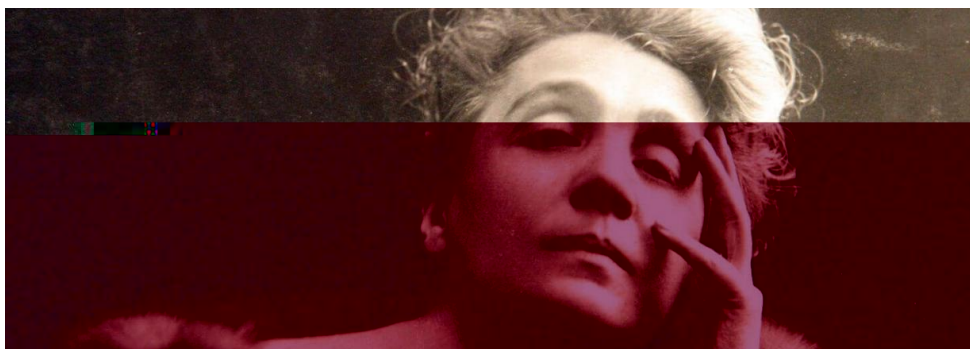
Figura 8: Eleonora Duse in Spettri (1922) da: Nella stanza di Eleonora Duse . Dal ritratto all'icona: il fascino di un'attrice attraverso la fotografia.

Una delle interpretazioni più intense alla quale assiste fu quella di Jeanne Eagles in Rain del commediografo britannico William Somerset Maugham. Eagles fu una attrice che, allo stesso modo di Ben – Ami, riusciva a coniugare le emozioni del personaggio con le emozioni dell'interprete stesso e questo affascinava molto Strasberg 99 . Due delle rappresentazioni e interpretazioni che più rimasero impresse nella sua mente di giovane amante del teatro furono quella di Eleonora