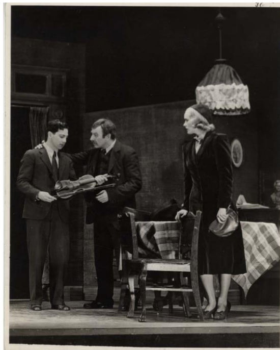
Figura 4: Golden Boy , [Scene at the Bonaparte's home in Golden Boy .] 1937.

L'opera racconta la storia di un ragazzo, Joe Bonaparte che per sensibilità e gusti vorrebbe diventare un violinista ma alla fine per non deludere le aspettative sociali diventerà pugile. L'azione ruota attorno alla lotta di Joe tra una vita di soddisfazione come musicista o la fama e la fortuna da trovare sul ring: