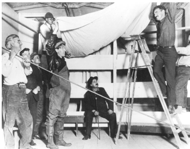
Figura 1: Membri del Provincetown players recitando sul palcoscenico per la rappresentazione di O'Neill Bound East for Cardiff nel 1916.

L'opera riscosse molto successo a tal punto che la compagnia si trasferì al Greenwich Village fondando il Playwright's Theatre. Questo successo però, allarmò Cook che vide sfumare il suo sogno di idealismo astratto per lasciar spazio ad una compagnia professionale che si dava al teatro commerciale. L'esperienza si concluse, però, nel 1924, quando l'attività del gruppo venne sospesa e Cook si trasferì in Grecia.