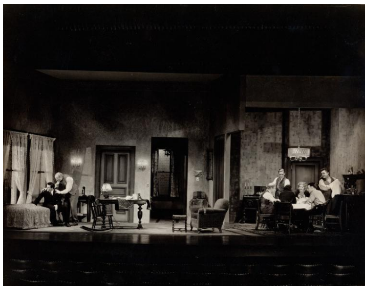
Figura 18: Ensemble in Awake and Sing! Vandamm, 1935.

Dopo pochi giorni dalla rappresentazione di Waiting for Lefty , andò in scena Awake and Sing che fu rappresentato al Belasco Theatre, il 19 febbraio del 1935, con la prima regia, nel Group, di Harold Clurman, e le scene di Boris Aronson. Lo spettacolo mostrava un amaro ritratto di una famiglia ebrea di ceto medio-basso travolta dalla depressione 196 .