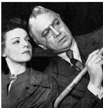
Figura 22: Eleanor Lynn and Luther Adler in the original Broadway production of Rocket to the Moon (1938).

La stagione si aprì con una tournée di Golden Boy che permise di affrontare l'avvenire con una relativa tranquillità. Lo spettacolo che inaugura l'ottava stagione del Group Theatre è Rocket to the moon di Odets.