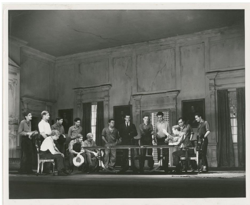
Figura 11: Franchot Tone (seated, pointing) in the stage production The House of Connelly .

“The night before our last in Brookfield Center we gave a run-trough of Connelly which a few visitors [...] attended [...] There was, of course, no scenery, no costumes, not even a stage” 141 , l’ultima sera prima di lasciare il Connecticut, The House of Connelly fu messo in scena. Non avevano nulla, non c’erano costumi