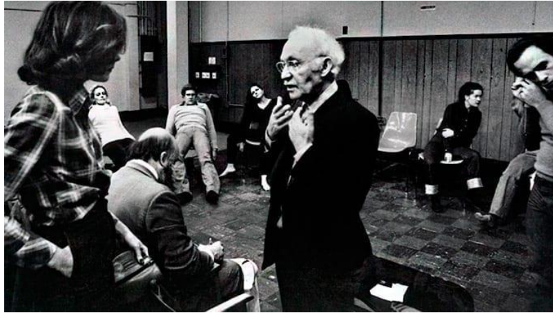
Figura 25: Strasberg che insegna all'Actors Studio

provata a lungo, qualche volta improvvisata. Al termine spiegavano quali erano state le loro intenzioni, indicavano i problemi incontrati e le soluzioni tentate 320 ”.