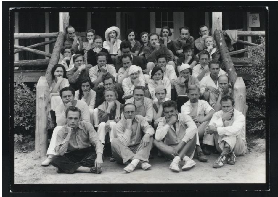
Figura 6: Gruppo di attori del Group Theatre.

Un altro elemento rappresentativo della tradizione del Group Theatre, oltre alla scelta del copione e alla possibilità di inscenare personaggi che rappresentassero il proletariato, è la creazione di un gruppo di attori, che vada oltre il palcoscenico