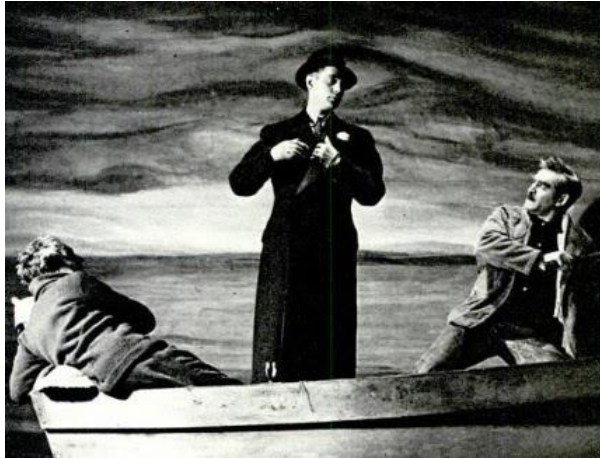
Figura 23: Franchot in The Gentle People . February 6, 1939.

Dopo poco tempo, il 5 gennaio del 1939, andò in scena The Gentle People di Irwin Shaw.