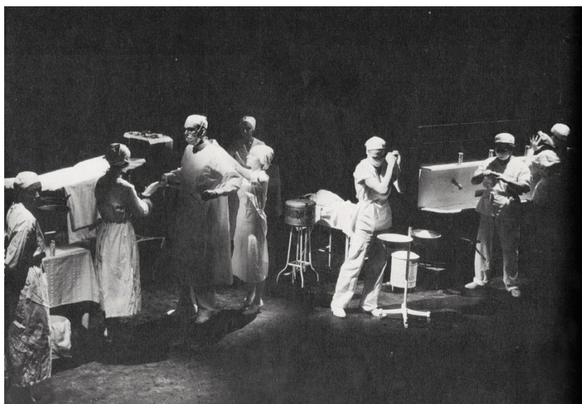
Figura 15: Clifford Odets, Elia Kazan, Luther Adler, Men in White , Pulitzer Prize, Sanford Meisner, Sidney Kingsley, the Group Theatre, 1933.

Il direttore pensava infatti, che fosse meglio che la compagnia passasse nelle mani di un'unica persona, o al massimo due, e si propose come unico direttore della compagnia sostenendo che le compagnie dirette da un'unica persona erano gestite meglio. Gli attori però, si rifiutarono di sottomettersi a questa decisione e: “[...] the majority voted an Actor’s Committee, which was supposed to advise with the directors on the Group’s various problems” 180 . Gli attori erano stanchi di essere solo uno strumento per mettere in scena le opere, volevano poter dare il proprio contributo alla crescita della compagnia.