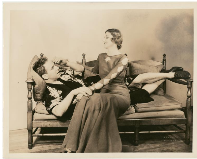
Figura 16: Lloyd Nolan and Stella Adler in the stage production Gentlewoman, 1934.

Il secondo spettacolo della terza stagione, però, al contrario del primo, fu un fallimento. Nel marzo 1934 al Cort Theatre il Group Theatre mise in scena Gentlewoman , un testo di John Howard Lawson, diretto da Strasberg. Il dramma mostra la relazione tra un giovane con idee politiche di sinistra ed una donna dell'alta borghesia. Il Group pensava di mettere in scena una romantica situazione attuale, visto il gran fermento politico rivoluzionario che si stava