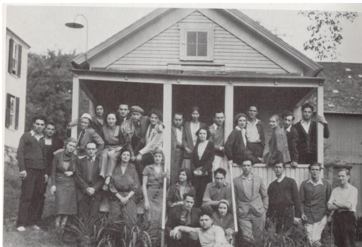
Figura 9: Il Group è la nostra vita: l'intera compagnia al Brookfield Center.

Tempo dopo, per non tagliare completamente i rapporti con il Guild, che comunque aveva avuto un ruolo importante per la formazione dei tre, la Crawford chiese di finanziare uno “Studio” proposto dal nuovo Group Theatre. Il Guild non accettò a pieno la proposta, ma le diede i diritti per mettere in scena un’opera di Paul Green, The House of Connelly , con un finanziamento di mille dollari. A finanziare l’inizio di questa esperienza saranno anche Maxwell Anderson ed Edna Farber, due drammaturghi americani. L’8 giugno del 1931, il gruppo, lascia New York e si ritira in campagna, nel Connecticut, per le prove. C’erano circa ventotto attori, comprese le loro famiglie, oltre i tre registi, la cui