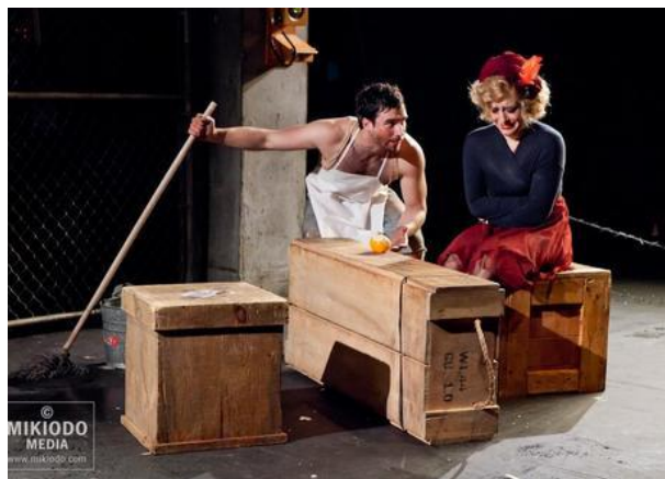
Figura 26: 1931 , Re Group Theatre.

Uno degli spettacoli del ReGroup che più ha colpito il pubblico è stato 1931 . Nella nuova produzione del Re Group messa in scena nell'ottobre del 2012, la compagnia offre una nuova chiave di lettura all'opera, più incentrata sui sentimenti del protagonista, sulla disperazione e la miseria per la perdita del suo lavoro: