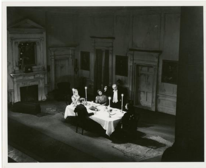
The House of Connelly , messo in scena dal Group Theatre nel 1931.