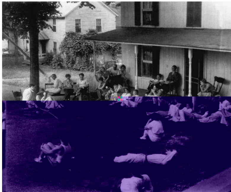
Figura 10: Brookfield Center, estate 1931, foto di Ralph Steiner.

La compagnia affittò una serie di baracche ed un granaio e si impegnò a vivere e provare lì per diverse settimane.