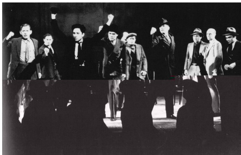
Figura 3: Waiting for Lefty , Group Theatre 1935.

Lefty divenne rapidamente un simbolo della rivoluzione proletaria e fu messo in scena in tutto il paese. Lo spettacolo era nuovo, eccitante, fece impazzire il pubblico e catturò la sensazione degli anni '30 che qualcosa doveva essere fatto 39 .